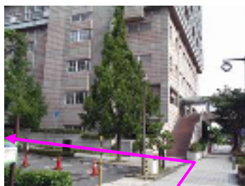
西神中央駅方面から